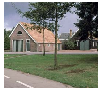
De voormalige timmerwinkel van de kolonie.

Humanitas – De Tuinen – Beeldentuin – Schrijversfestival – Ronde van het Sterrebos Mooi mozaïek bij entree Frederiksoord?