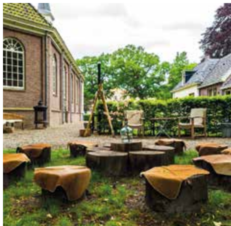
Koloniekkerkje, Foto Remke Maris.

FREDERIKSOORD – De redactie vroeg een aantal particulieren, ondernemingen en verenigingen in Frederiksoord en Wilhelminaoord naar de gevolgen van de Coronacrisis en de ervaringen tijdens de lockdown.